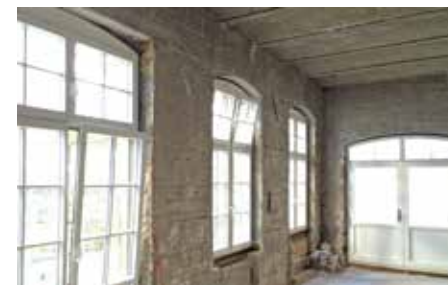
vor der Sanierung

Eine kleine Bauherrngemeinschaft besitzt eine alte Remise mit einer profilierten Ziegelfassade. „Zunächst waren wir skeptisch,“ beschreiben sie ihren Entschluss, die Außenwände von innen zu dämmen. „Aber die Heizkosten waren hoch und ein Wärmedämm-Verbundsystem kam wegen der historischen Fassade nicht in Frage. Die Ziegelansicht sollte unbedingt erhalten bleiben.“