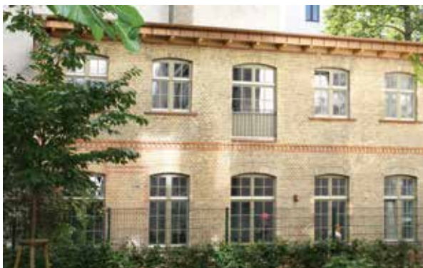
Historische Remise mit Ziegelfassade und Innendämmung

Unser Ziel ist die Definition von Qualitätsmerkmalen auf der Basis anerkannter Standards und der Abbau unbegründeter Ängste vor Innendämmungen. Dies wollen wir durch ein Schulungs- und Zertifizierungssystem, durch aktive Mitarbeit an Regelwerken sowie durch Weiterbildungsmaßnahmen erreichen. Wissenstransfers für Planer, Handwerker und Bauherren sollen bei der Planung und Ausführung von Innendämmungen technologieneutral höchste Qualitätsstandards dauerhaft und zuverlässig gewährleisten.