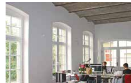
nach der Sanierung

Die Entscheidung haben sie nicht bereut und freuen sich: „Die Wohnung wird spürbar schneller und mit geringerem Energieeinsatz warm. Die damit verbundene Raumtemperatursenkung um etwa 2°C kann bis zu 12 % der Heizkosten einsparen.“ Die Kombination aus Wärmedämmung und Diffusionsoffenheit beugt Schimmelbildung vor und sorgt so für ein gesundes Wohnumfeld.