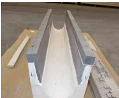
Bild 1: FF-Fertigbauteil für HSG, präpariert mit 4 Calciumsilikat-Werkstoffen

Darauf aufbauend war deren Eignung unter rauen Industriebedingungen in Langzeitversuchen über mind. 14 Wochen als Feuerfest -(FF-) Fertigbauteil mit 1 m Länge in der ca. 10 m langen Zuführrinne der Horizontal-Strang-Gussanlage (HSG) beim Industriepartner TRIMET in Essen nachzuweisen. Dafür wurden bei CALSITHERM Standardrinnen von TRIMET im signifikant korrosionskritischen Dreiphasenbereich, also am Übergang von Al-Schmelze zur Atmosphäre, mit den neuen CS-C-Werkstoffen ausgekleidet. Bild 1 zeigt das präparierte FF-Fertigbauteil. Bild 2 zeigt das FF-Fertigbauteil, wo im Dauerversuch kontinuierlich Al-Schmelze hindurchströmt. Die Hellfärbung im sichtbaren Bereich über dem Schmelzespiegel ist durch Kondensation oxidischer Dämpfe der Al-Schmelze auf die kälteren CS-C-Oberflächen entstanden. Un-