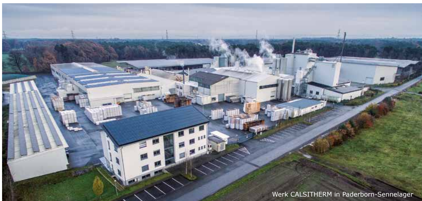
Werk CALSITHERM in Paderborn-Sennelager